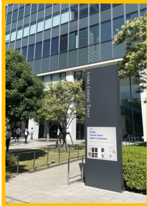
「東京ビッグサイト」駅からの入り口